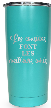
Les cousines font les meilleurs amis 452