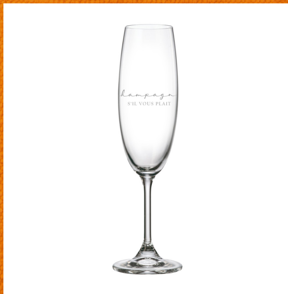
Champagne s'il vous plait 278