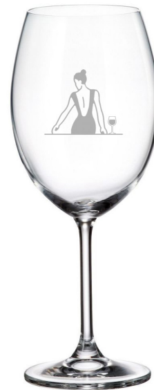
Femme assise de dos 315