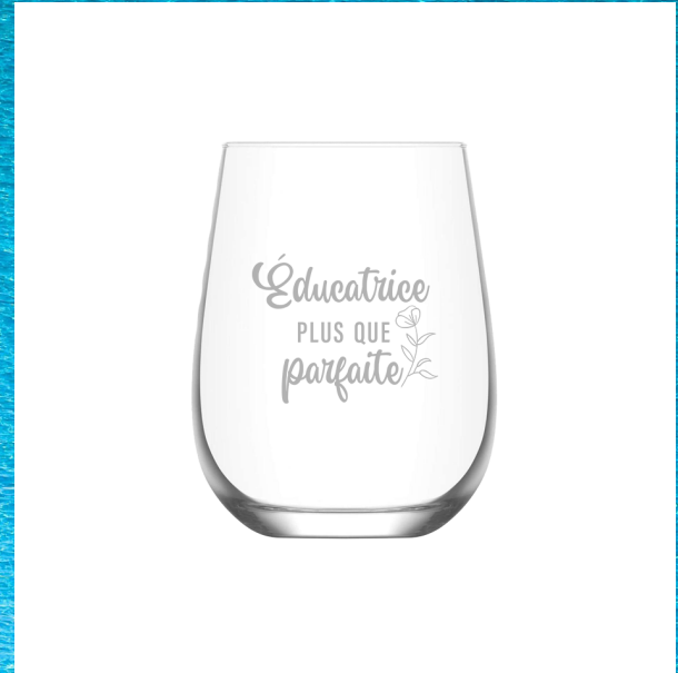
Éducatrice plus que parfaite