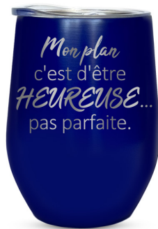
Mon plan c'est d'être heureuse... 395