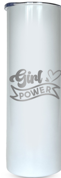
Girl Power 334