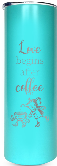
Love begins after coffee 424