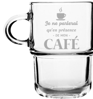
Je ne parlerai qu'en présence de mon café 271