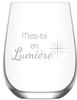
Mets-toi en lumière 318