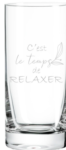
C'est le temps de relaxer 534

Commandez en quelques clics: https://distributeur.lamaisondubar.com/