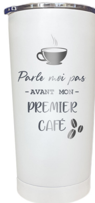
Parle moi pas avant mon premier café 366