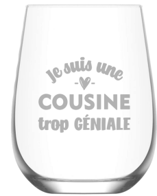
Je suis une cousine trop géniale 462