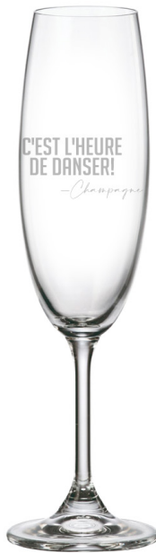
C'est l'heure de danser! 282-champagne