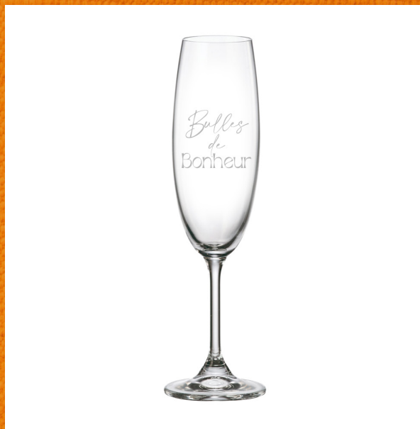
Bulles de bonheur 280