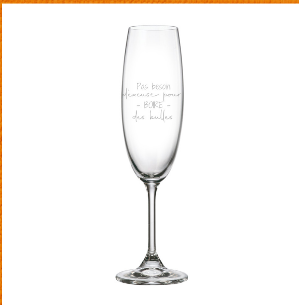
Pas besoin d'excuse pour boire des bulles 295