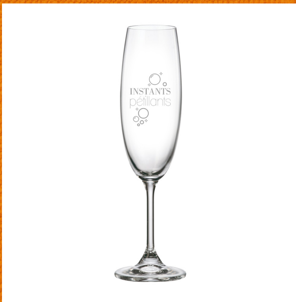
Instants pétillants 281