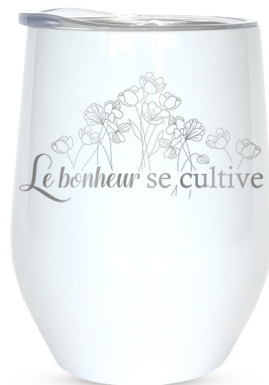
Le Bonheur se cultive 521