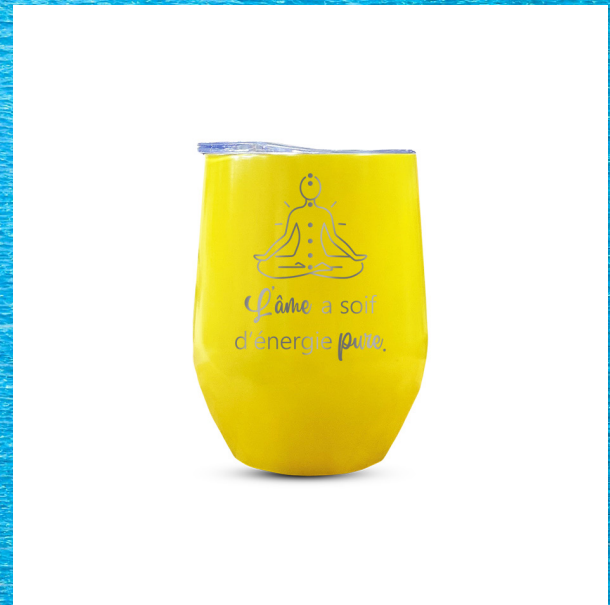
L'âme a soif d'énergie