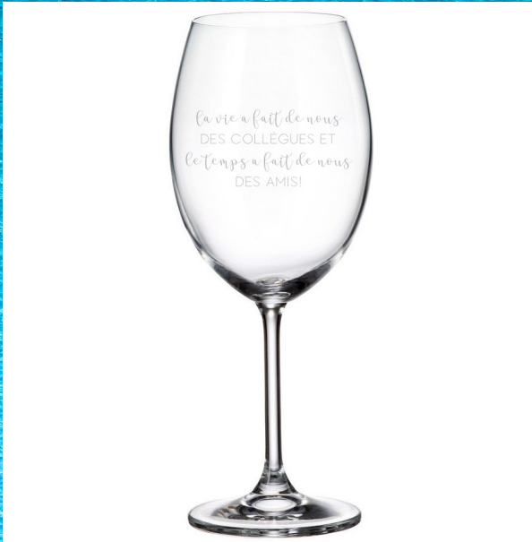
La vie a fait de nous des collègues