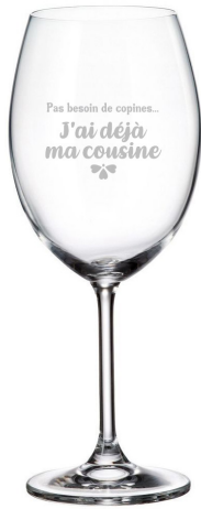
Pas besoin de copines, j'ai déjà ma cousine 428