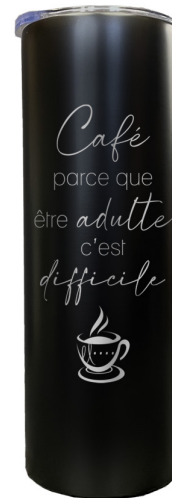
Café parce que être adulte c'est difficile 557